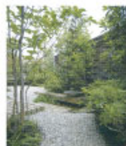
カマクラヒバの生垣 h1.5