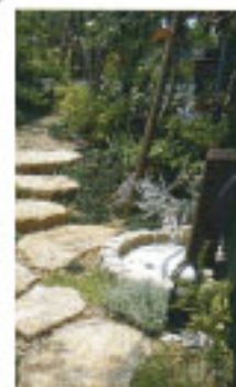
立水栓のイメージ 土間コンクリート (縁石使用)