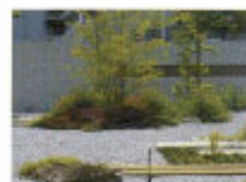
青碎石のイメージ